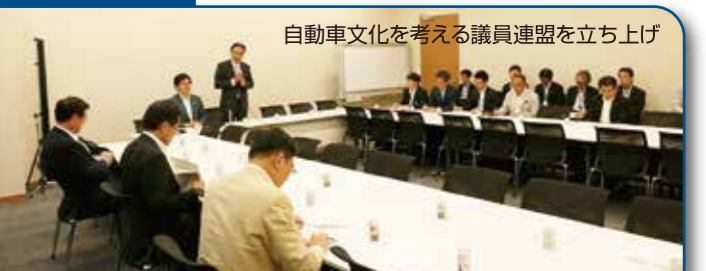
自動車文化を考える議員連盟を立ち上げ

議員立法として、消防団基本法、国土強靱化法、山の日制定法を成立させました。現在も自転車基本法案、農山村教育交流、建設現場の安全対策、クラシックカーの課税見直しなどの法案づくりに取り組んでいます。また水道議連事務局長、災害対策特別委員会事務局長、再生可能エネルギー普及拡大委員会座長、として制度改正・予算確保に努めています。