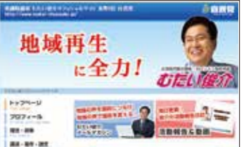
▲むたい俊介公式ホームページ