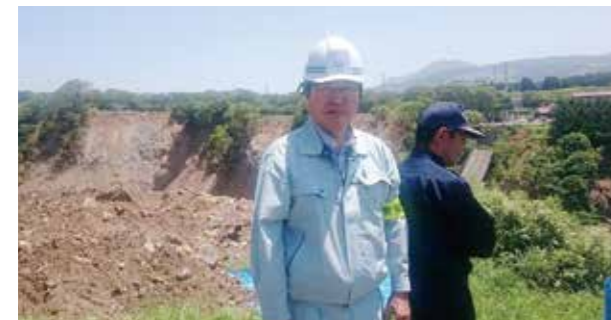
▲衆参災害対策特別委員会の視察で阿蘇大橋の崩落現場へ