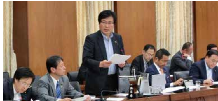
▲衆議院災害対策特別委員会で質問

災害対策特別委員会で熊本地震の視察を受けて質問。熊本地震への政府の対応と今後の防災体制の充実について質問しました。予算委員会分科会や、総務委員会などでも質問の機会をいただき、政府としっかり建設的な議論をしています。