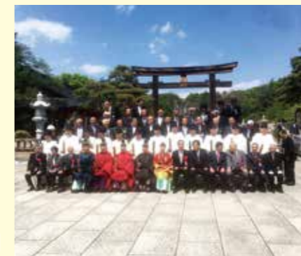
長野県護国神社例大祭にて