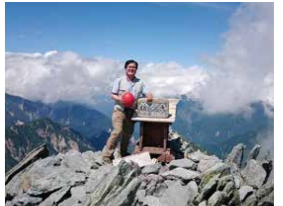
▲槍ヶ岳山頂に立つ