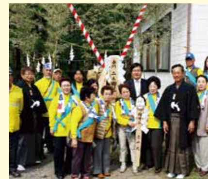
戸隠の御柱祭に参加