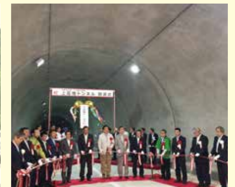
上高地トンネル開通式にて