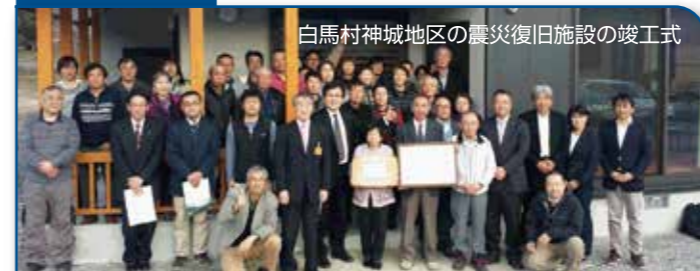
白馬村神城地区の震災復旧施設の竣工式