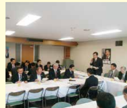
党災害対策特別委員会で地元 自治体から雨水被害のヒアリング