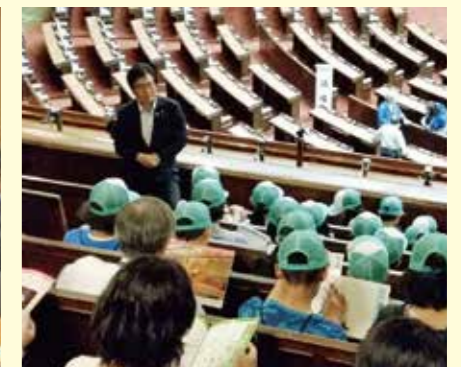
地元の小学生に 衆議院本会議場を案内