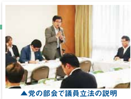
▲党の部会で議員立法の説明