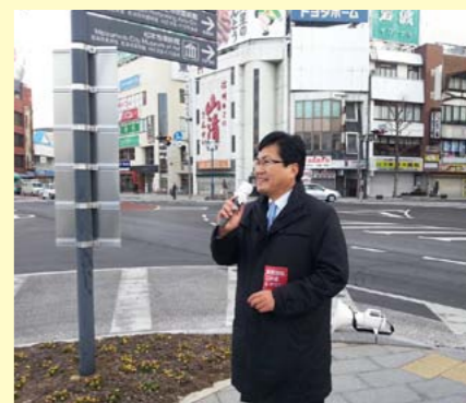
松本駅前で当選報告の街頭演説