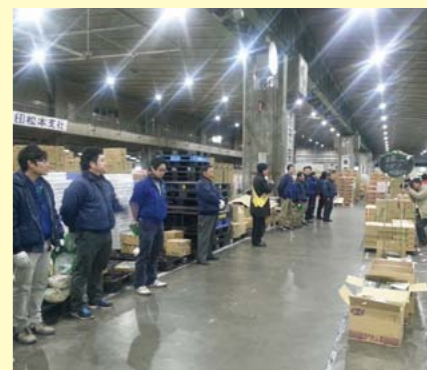
松本市公設市場の競りで挨拶