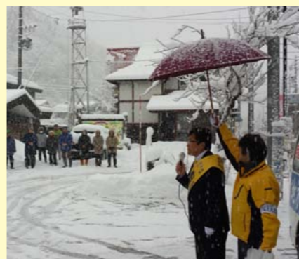
小谷村の支援者の皆様に挨拶