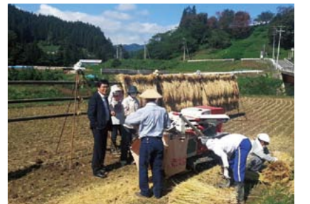
▲長野市鬼無里地区の家族総出の収穫作業