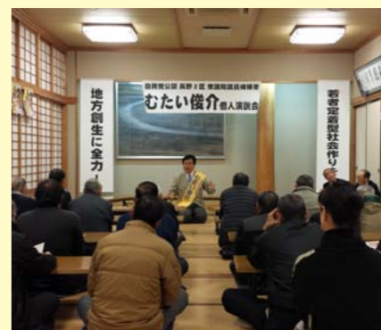
長野市戸隠にて個人演説会