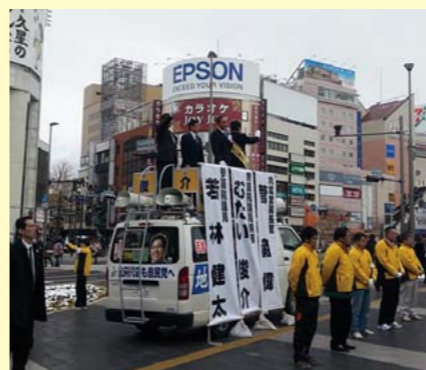
菅官房長官と松本駅前街頭演説