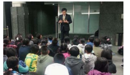
▲修学旅行の小学生に国会議事堂を案内