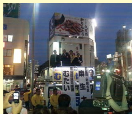
麻生財務大臣と松本駅前街頭演説