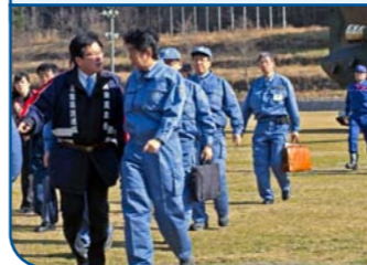
▲長野県神城断層地震災害の視察に訪れた安倍総理に駆け寄り話しかける