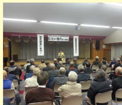
小川村の個人演説会にて