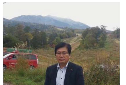
▲御嶽山五合目八海山から、噴煙上がる御岳山を遠望