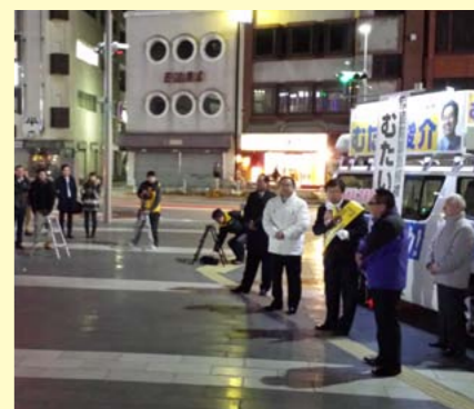
松本駅前マイク納め