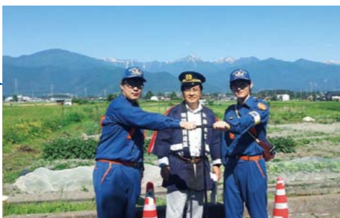
▲安曇野市消防団ポンプ操法大会を激励

党消防議連PT事務局長として「消防団を中核とした地域防災力充実強化に関する法律」を成立させることができました。これにより多くの自治体の消防団の処遇・装備の充実と地位向上が図られます。災害が多発する昨今に、地域の消防団がしっかりと活躍できる地盤づくりが全国で進んでいます。