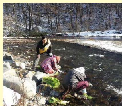
朝日村鎖川清流の野沢菜洗いに遭遇