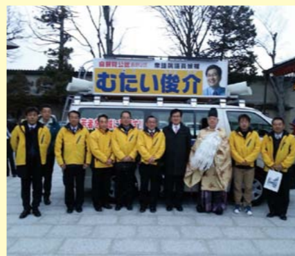
街宣車運用部隊のお祝い