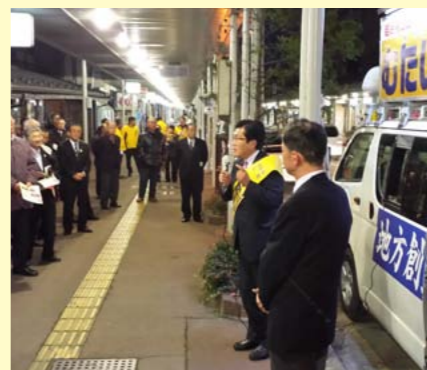
大町市内の出陣式にて