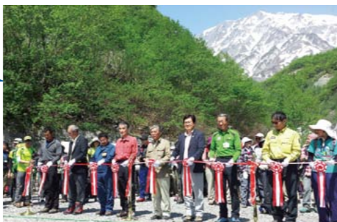
▲白馬連峰の開山祭にて

平成28年から8月11日が「山の日」として祝日になります。昨年の超党派議連の設立から、事務局長として奔走。上高地の山岳関係者を交えた合宿などを経て祝日化を実現しました。山の恵みに感謝するとともに、安全安心に、山に親しむための「山の日」の制定により、山に囲まれた信州の魅力をも日本全体に、世界に発信する好機となることを願っています。