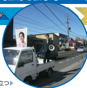
軽トラ荷台にて街頭に立つ▶

早朝より、松本駅前、深志2丁目交差点、千歳橋交差点、花時計公園前にて軽トラの荷台から演説。