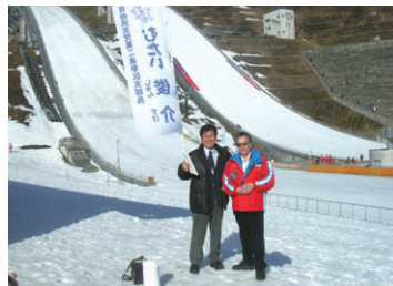
白馬のジャンプ大会にて(2月)