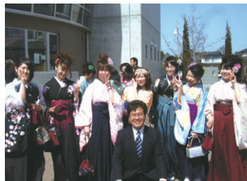
松本大学卒業式で卒業生と(3月)