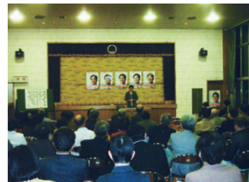
梓川地区後援会集会の模様(4月)