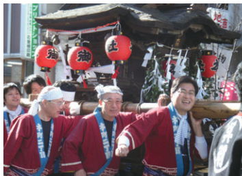
松本市「あめいち」にて(1月)

18時から地域の方10名と懇談後、明科潮公民館で13名のミニ集会。郵政民営化、中小企業対策、国のプロジェクトの誘致、地域資源の発掘、参議院の存在意義、政治家の資質などについて意見交換。