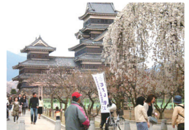
松本城公園を自転車で回る(4月)